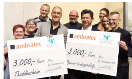
1. SOS-Kinderdorf Düsseldorf. 2. Kindergarten Bad Kreuznach. 3. Thaddäusheim für Wohnungslose in Mainz. 1. SOS Children's Village in Düsseldorf. 2. kindergarten in Bad Kreuznach. 3. Thaddäusheim in Mainz for homeless people.