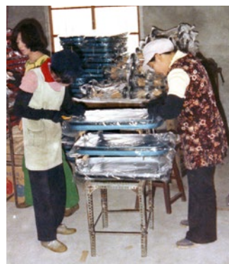
Produktionsunternehmen Hsin Ho Production company Hsin Ho

First steps abroad In the late 1960s, Berner establishes initial foreign subsidiaries. In April 1969, Berner Belgium opens, which today together with the Netherlands and Luxembourg forms the region "West." In 1972, the promise "We understand your craft" is born. It is the hour of birth of BTI Befestigungstechnik in Ingelfingen, now one of the construction industry's leading solution providers with a focus on fire protection.