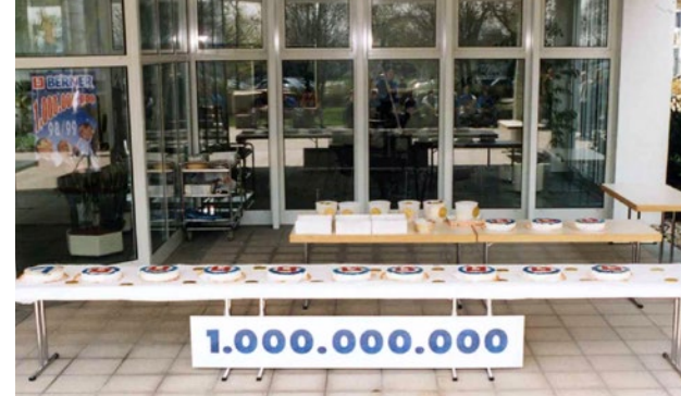
Feier mit Kuchen zur ersten Umsatzmilliarde in Künzelsau Celebrating the billion sales mark with cake in Künzelsau

From Europe to Asia After opening Berner Italy in 1974, the most ambitious project to date is launched. Berner takes over the Hsin Ho company, a factory for screws and fastening components, thereby taking the plunge into production as well as sales. By 1983, the group has increasingly become international and needs a central management unit. The holding company is established. In the following years, Berner expands with additional foreign subsidiaries in Norway, Sweden, and Luxembourg