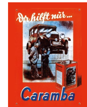
Caramba Emaille-Schild Caramba advertisement