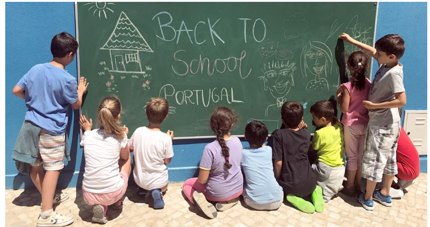
Eine neue Tafel für den Schulhof. Die Kinder der Manique Junior School nutzten das Geschenk von Berner sofort.

A new chalkboard for the schoolyard. The children of Manique Junior School immediately took advantage of Berner's gift.