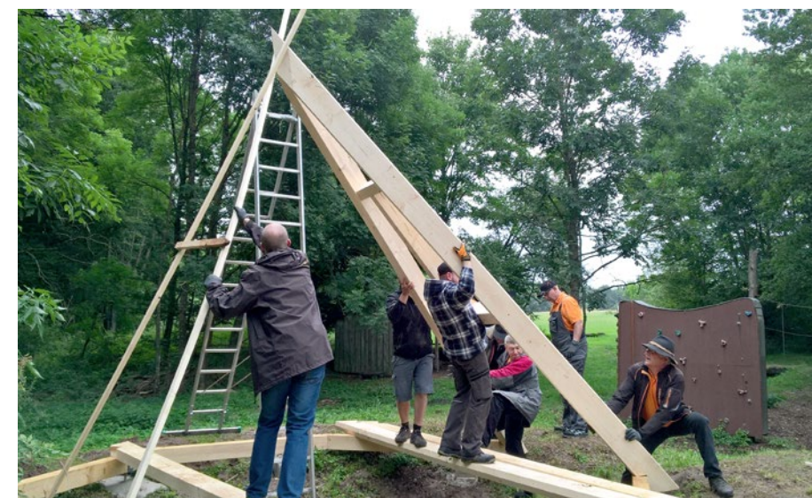
Ein Holzelt für das Albert-Schweitzer-Kinderdorf, Waldenburg.