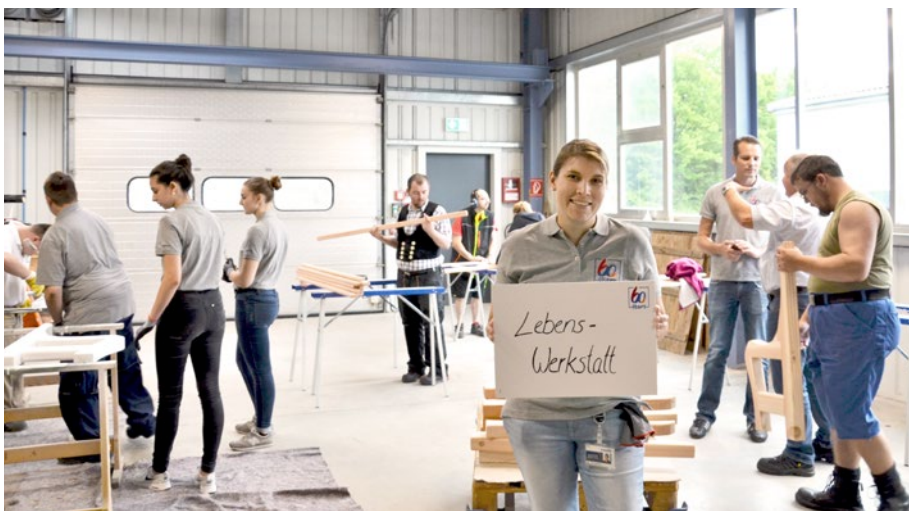
Employees of the LebensWerkstatt and Berner during the construction of the new benches.